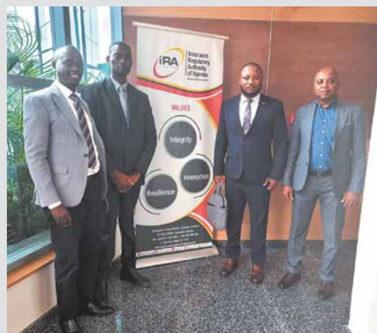
ISSM, IP busca experiências nos países da África oriental

A presente iniciativa foi criada, com o intuito de preparar a retenção da parte do risco pelo sector de seguros, no âmbito do conteúdo local e a respectiva negociação para colocação da outra parte de risco no mercado internacional em regime de resseguro facultativo.