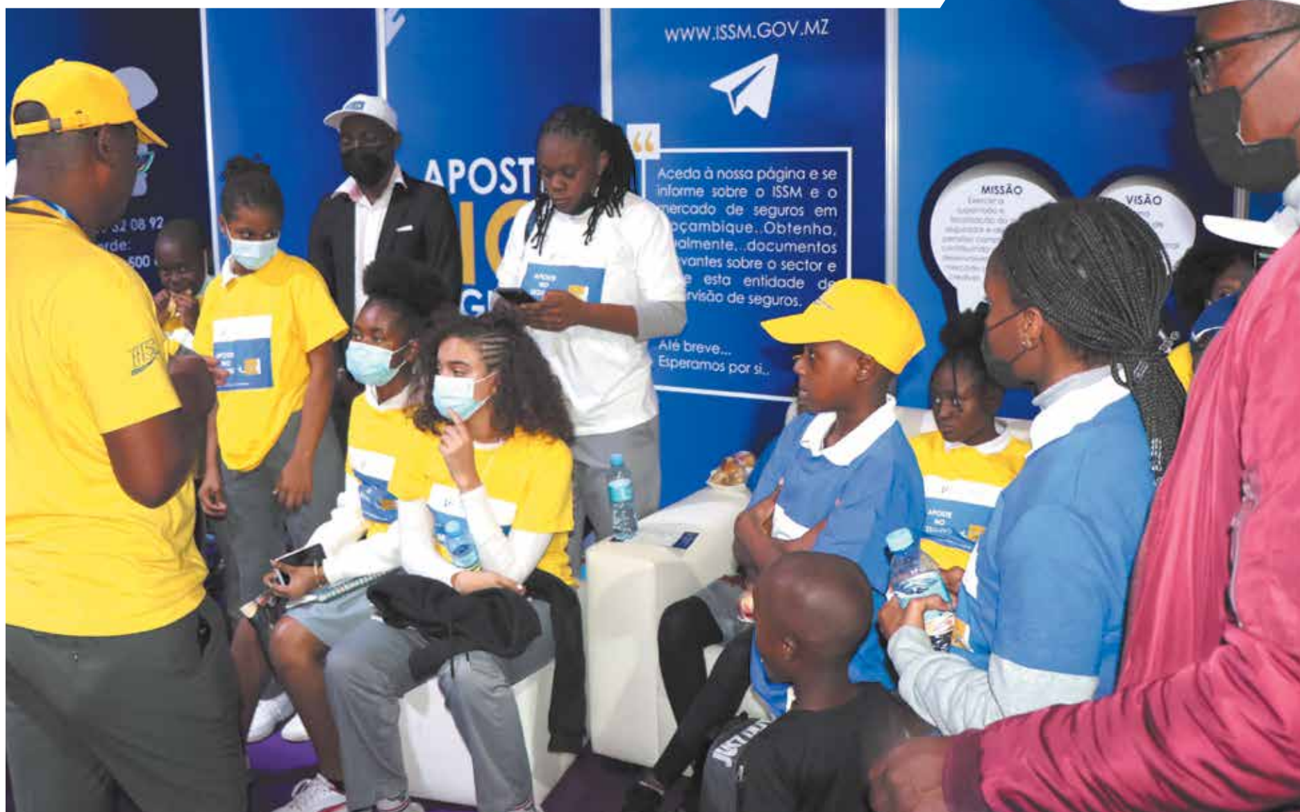
Estudantes do Colégio Shalon, beneficiaram-se de uma palestra em matéria de seguros