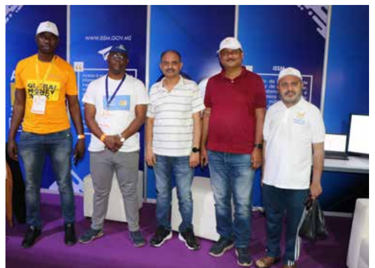
CEO da Phoenix Companhia de Seguros, Pronab Sen, visita stand da ISSM, IP