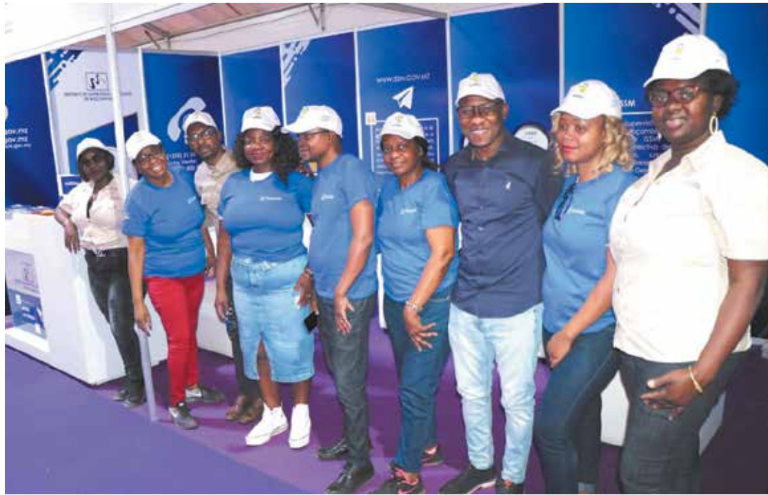
Funcionários do ISSM, IP

A participação do ISSM, IP, permitiu ainda a promoção das actividades do sector segurador, troca de experiências e fazer demonstrações práticas aos tomadores de seguros sobre as novas formas de atendimento de consumidores através das plataformas digitais disponibiliza-